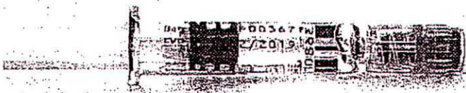
Figura 2. Pistonul seringii poate fi tras în această poziție