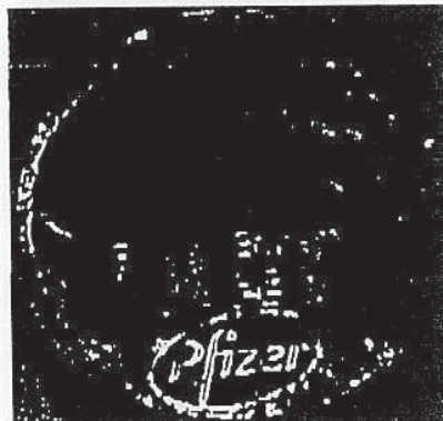
Figura nr. 2: Sigiliu falsificat