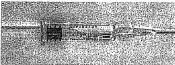
Figura 3. Pistonul scos complet în afară, cu pierderea sterilității produsului